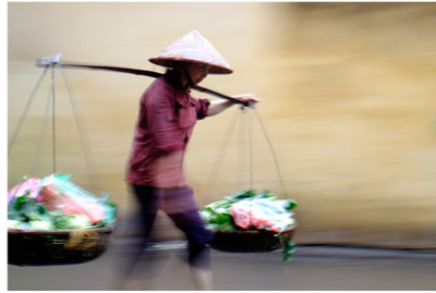
La plus nette au niveau du visage, mais ce n'est pas ce qui recherché ici