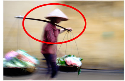
La plus floue, mais cela permet de se concentrer sur l'essentiel, la courbe des épaules, le fléchissement des genoux ...

L'image avec le visage plus net aurait attiré l'attention sur le visage – qui en l'occurrence n'exprimait que la concentration. En Asie, le corps parle souvent plus que les visages. Dans la troisième image, un flou plus prononcé permet de se focaliser sur les épaules, les genoux, qui montrent les signes de lassitude et de fatigue. L'inclinaison de la palanche est aussi essentielle.