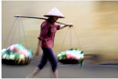
La plus réussie techniquement, mais elle fait trop dynamique